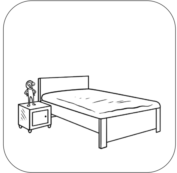
PRZY ŁÓŻKU STOI SZAFKA.