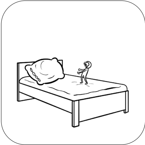
NA ŁÓŻKU LEŻY PODUSZKA.