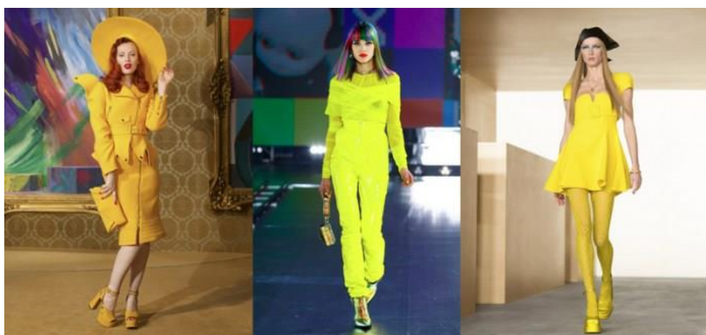
Kolekcie jeseň/zima 2021/2022 – Moschino, Dolce and Gabbana, Versace.

Táto zmes radostného oblečenia je protiváhou k pohodliu , do ktorého sme boli v minulom roku zabalení. Móda je teda späť a môžeme vítať jej energický a žiarivý návrat.